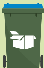
Oud papier en karton

Meer weten over afval scheiden? Kijk in de ACV-app of op www.acv-groep.nl .